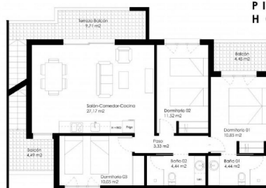
Planta primera_Escala: 1/100