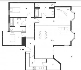
Piso en calle Alcaucin Marbella (Málaga)

Piano orientativo, no consideren documento contractual. Mobiliario indicativo de posible distribución